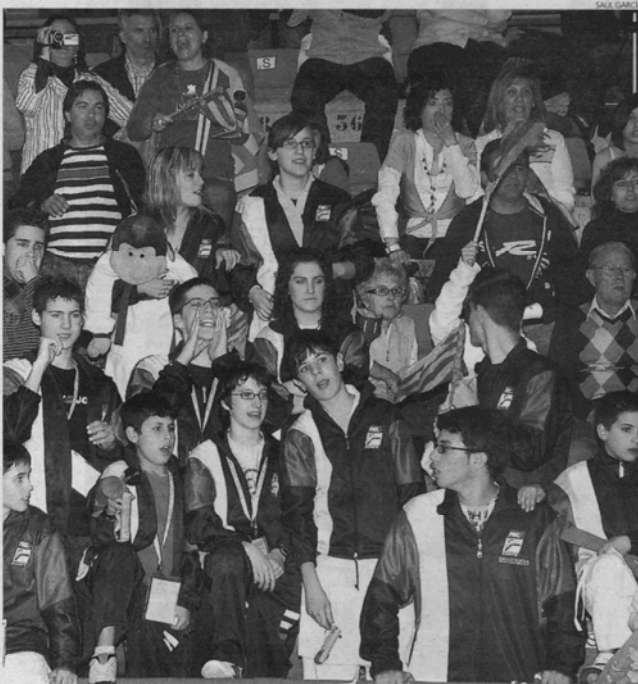
La afición llenó las gradas de El Sargal durante toda la jornada de ayer.