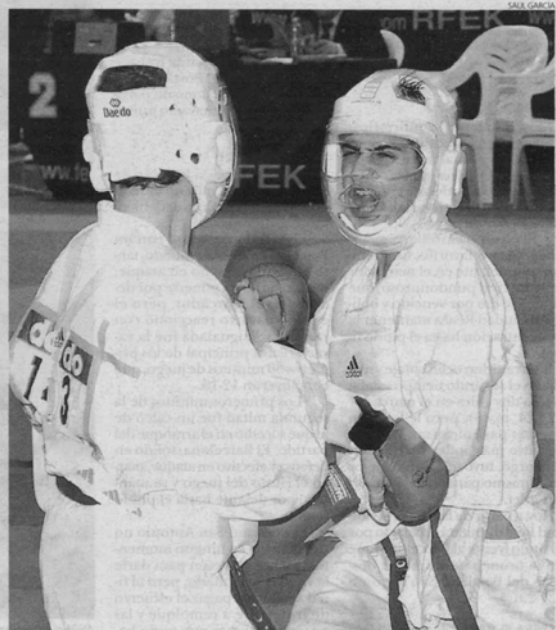
Arriba, uno de los combates disputados ayer en El Sargal.