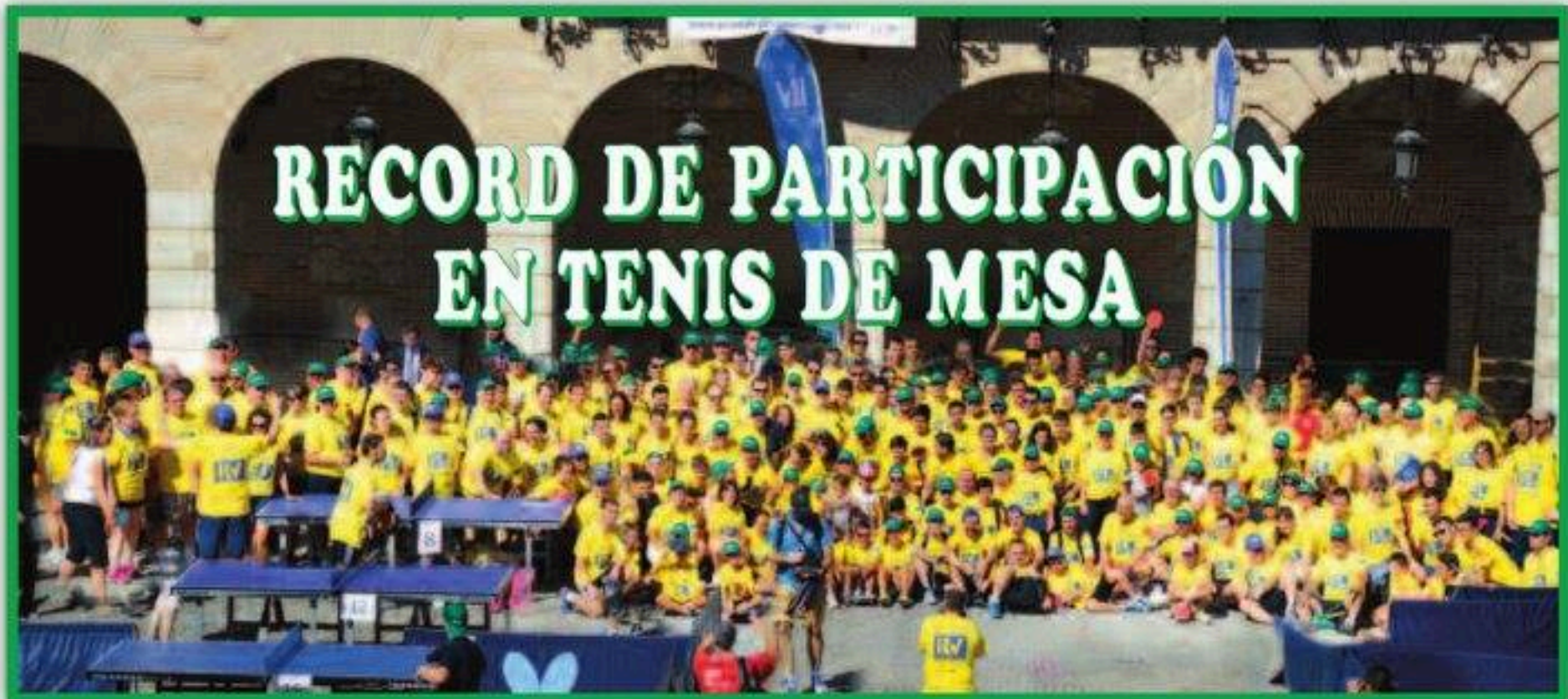
RECORD DE PARTICIPACIÓN EN TENIS DE MESA