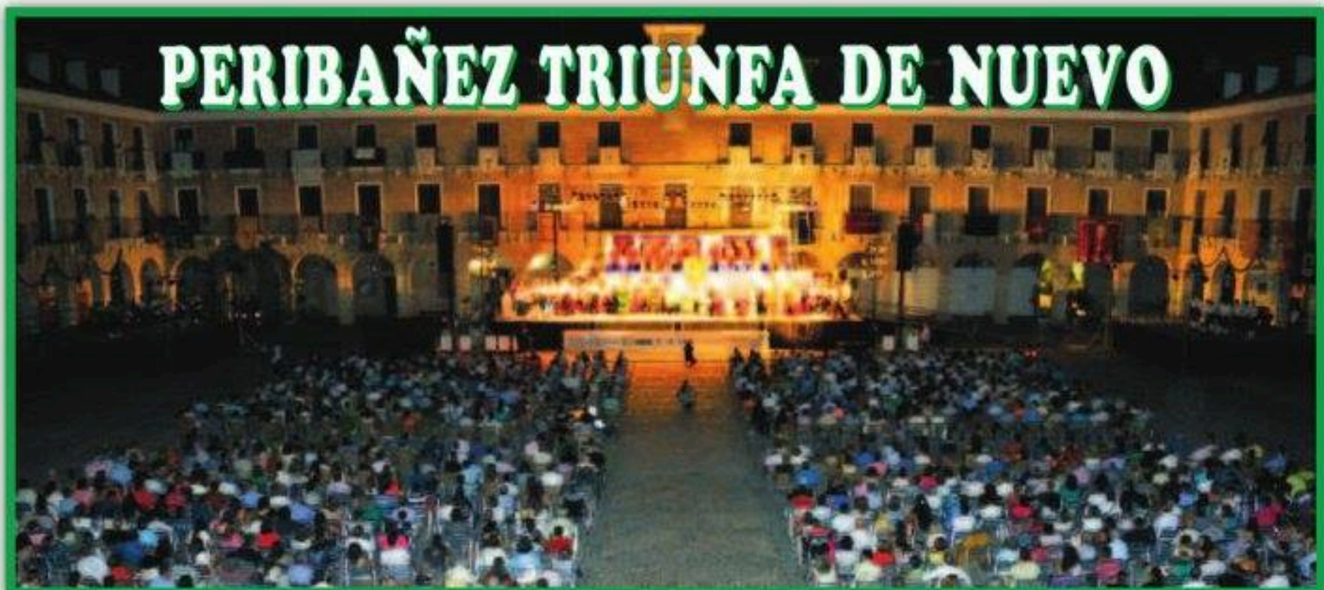
PERIBAÑEZ TRIUNFA DE NUEVO