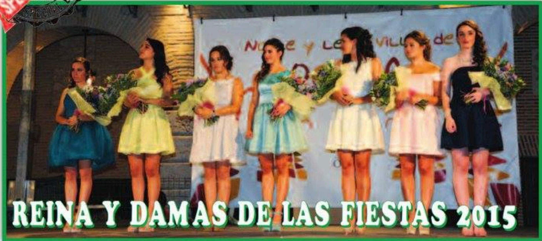
REINA Y DAMAS DE LAS FIESTAS 2015

DEPENDIENTE DE INFORMACIÓN LOCAL Y GENERAL · AÑO XI · NÚMERO 127 · JULIO/AGOSTO 2015